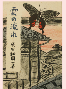
遺歌集『雲の流れ』表紙▲(作画 裕伊之助)

【臨時休館のお知らせ】 10月27日(火)～29日(木)は展示替えのため休館します。