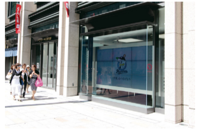
▲千葉銀行東京営業部(日本橋コレド室町3)

株式会社千葉銀行の協力で、8月から千葉銀行東京営業部正面入り口脇に設置されている46インチ9面マルチディスプレイで放映します。