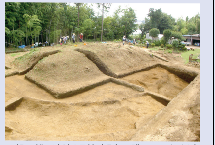
▲根戸船戸遺跡1号墳(現在は残っていません)

平成26年5月から8月、白山3丁目にあった古墳(根戸船戸遺跡1号墳)の発掘調査が行われました。古墳は全長35m、手賀沼に向かって開く横穴式石室をもつもので、古墳時代終末期(6世紀末から7世紀初め)の、地域を治めた豪族の墓と考えられます。石室は長年の時間の経過のためか、天井の石が崩落し、内部に落ちていました。調査が終盤を迎えた7月のある日、石室の床面近くで、灰色に慣れた目に鮮やかなグリーンが飛び込んできました。「銅だっ!!」発掘現場に緊張が走ります。グリーンは銅の錆である「緑青」で、貴重な銅製品が出る予兆なのです。慎重に石を除いていくと、赤茶色を帯びた鉄と銅が絡み合っている…それは鉄の刀に銅の飾り金具を付けた「飾り大刀」、それも柄の先端「頭」にコブシ型の「椎=槌」が付いていることから「頭椎大刀」と呼ばれる特殊な刀でした。