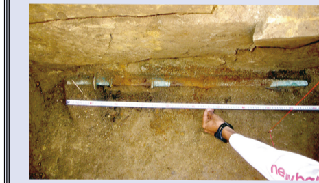
▲頭椎大刀出土状況

※根戸船戸遺跡1号墳は現在残っていません。私有地につき跡地見学もご遠慮ください。同様な古墳として根戸船戸古墳公園内に2号墳が残されているのでそちらを見学してください。