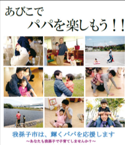
我孫子市は、輝くパパを応援します ～あなたも笑顔で子育てしましょう～