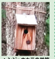
▲シジュウカラの巣箱

私たちの身近なところで繁殖している鳥には、巣を枝などで皿状に組んで作る鳥や、穴を利用して繁殖する鳥たちがいます。シジュウカラは、樹の洞や巣箱などの穴を利用する鳥としてよく知られていますが、そのほかに穴を利用する身近な鳥がいます。それは次のうちどれでしょう。