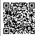
enjoyパパ応援プロジェクト ホームページQRコード

また、パパとお子さんが一緒に楽しめるよう、市内子育て支援施設4場(にこにこ広場、すくすく広場、わくわく広場、すこやか広場)では、広場スタッフによる「広場でパパを楽しもう!!」を開催しています。詳しくは毎月1日号の広報あびこをご覧ください。 ☎ 子育て支援センター ☎7185-1915