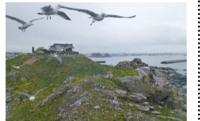
▲燕島のウミネコ繁殖地