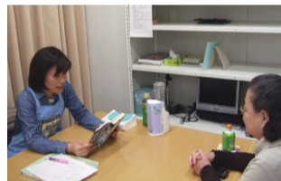
▲対面朗読サービスの様子