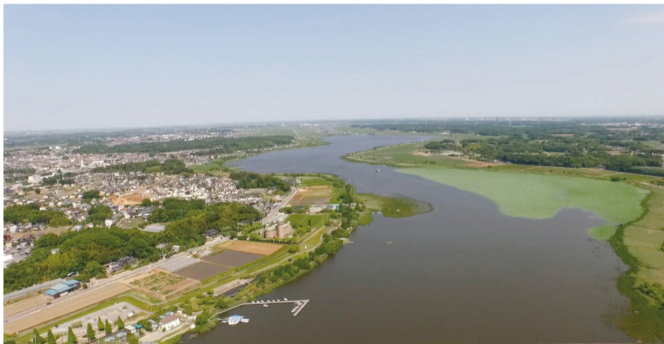
▲手賀沼と周辺の緑

市長 私の抱負は、市民の皆さんが我孫子に住んでよかった、これからもずっと住み続けたいと思ってもらうことです。財政的には非常に厳しいので、事業の優先順位をきちんと付けて、ニーズに合わせてやっていくしかないと思っています。特に子育ての政策は、長期のビジョンというより、若い世代の皆さんが何を求めているのか敏感に察して、必要であればどんどん変えていこうと思います。この水辺を大切に落着いた住環境の中で子育てをしやすいまちにしたいです。市の基本構想でも将来都市像を「手賀沼のほとり、心輝くまち／人・鳥・文化のハーモニー」としています。人と鳥の共存をめざしたまちづくりを進めていきたいと思えます。今日は、大変お忙しいところありがとうございます。 所長 こちらこそありがとうございました。