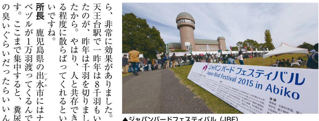
▲ジャパンバードフェスティバル (JBF)

所長 渡りをする鳥は日本だけでなく南の方の地域の環境劣化が激しいとかなりのダメージを受けます。北の方も同じ事が言えます。人間が環境をいかに保全できるかによって鳥の数も違ってきます。やはり温暖化の影響が出てくるんじゃないかという気がします。人間の力ではコントロールできないところもあります。我孫子は文化的でもともといいまちだと思います。やはり、手賀沼という自然があることは大きいですね。水質など一時期大変でしたが、今はだいぶよみがえってきました。せめて我孫子の環境はこのまま良い形で守っていただきたいなと思います。市長 手賀沼の水質も下水道や