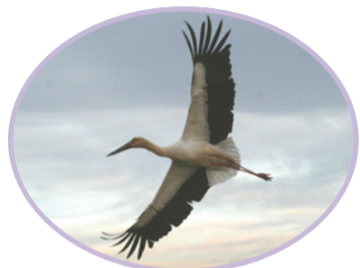
▲コウノトリ飛翔 市内北新田にて(平成17年1月撮影)