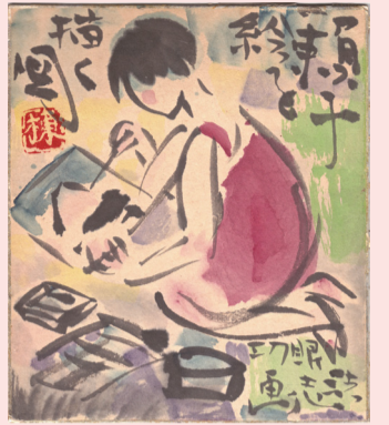
▲棟方志功「頼子絵を描く」昭和40年頃