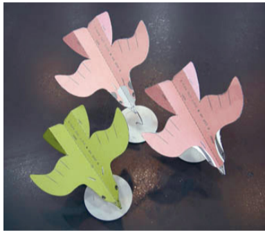
▲鳥型の紙ひこうき

鳥の博物館では、鳥の紙ひこうきを作って飛ばすイベントを開催します。普通の折り紙で作るものとは違い、航空力学の原理にもとづき設計された紙ひこうきで、ゴムの力で高く発射すると、長い時間大空を飛び続けます。みなさんもぜひ体験してみませんか?