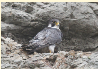
文 村松 和行(鳥の博物館学芸員)

私たちの身の回りには、鳥の名前がついているものがたくさんあります。ハヤブサもそんな鳥のひとつでしょう。カラスより