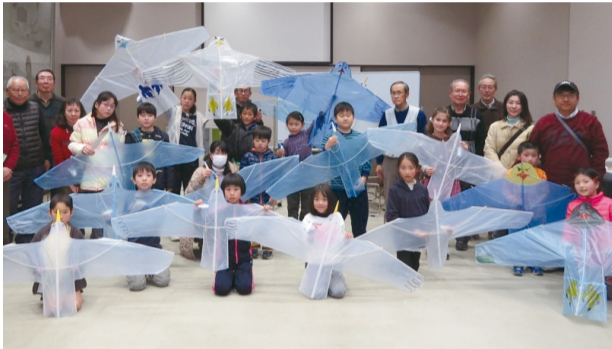
▲できあがった鳥凧と記念写真

日時 5月5日(祝)午後1時30分～3時30分 場所 鳥の博物館2階多目的ホール 内容 鳥凧同好会オリジナルのポリ袋を使った鳥凧を作ります。 指導 鳥の博物館友の会、鳥凧同好会 対象 小学生以上(低学年は保護者同伴) 定員 先着15組(1家族1つの製作) ※要申込 費用 無料(ただし高校生以上は入館料がかかります)