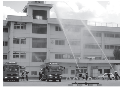
▲平成24年度総合防災訓練の様子

総合防災訓練は、茨城県南部を震源域とする地震により、市内で甚大な被害が発生していることを想定して実施します。地域の皆さんや関係機関などと連携したさまざまな訓練のほか、