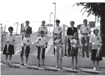
▲開通式に出席した根戸小学校と久寺家中学校の子どもたち