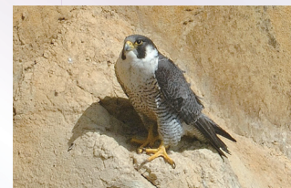
▲ハヤブサ