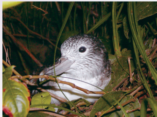
▲オオミズナギドリ