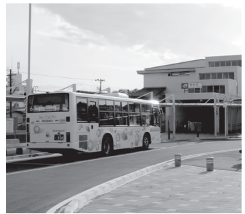
▲湖北駅北口の停留所

5月11日から湖北駅北口停留所が新設、民間路線バスが乗り入れを開始しました。これまで湖北駅北側から他地区へのアクセスは、国道356号沿いの停留所を利用するしかありませんでした。この度駅前広場の完成に伴い、「湖北駅北口」の停留所が新設され、阪東バスが運行する布佐駅南口から天王台駅南口を経由し、東我孫子車庫を結ぶ路線、湖北駅北口から天王台駅北口を結ぶ路線が乗り入れを