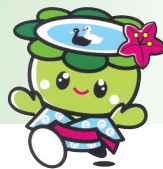
▲あびこカップまつりイメージキャラクター あびかちゃん