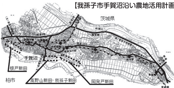
【我孫子市手賀沼沿い農地活用計画の対象地域】

◎農政課・内線513 ※各計画は、農政課、行政情報資料室、市ホームページでご覧いただけます。