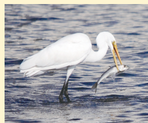
文 村松 和行(鳥の博物館学芸員)

ダイサギは一般に白鷺と呼ばれるものの中で一番大きい鳥で、我孫子では一年を通して見られます。長い脚で水辺を歩きながら、大きなピンセットのような長い嘴で器用に餌を捕まえます。餌は魚やカエルなどの水生生物で、時には写真のような大きな魚も捕まえます。手賀沼では岸辺だけでなく、水深が深い場所の網や杭にとまって餌を捜す姿も見られます。