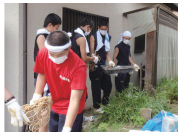
▲我孫子東高校生徒によるボランティア作業

に備えた備蓄 (学校)児童・生徒の安全確保と一時保護体制の確立 ・避難所開設時の開錠 ・避難者の受け入れや運営の協力 (福祉施設)入所者の安全な保護体制および備蓄の確保 共助 ：自主防災組織等の住民組織の役割を明確にしました。 ・自主防災組織の結成 ・発災時の地域の情報収集や情報伝達 ・災害時要援護者の安否確認や避難支援 ・避難所の自主的な運営など ◎庁内体制の強化 ・震度5弱以上で災害対策本部を自動設置し、全職員を自動配備 ・断水被害に特化した体制の整備など ◎復旧体制や情報収集伝達体制の整備拡充 ・学校の受水槽や耐震性貯水槽、災害用井戸などの整備拡充 ・防災行政無線(固定系・移動系)、MCA無線など複数の通信施設の整備 ・近隣センター等を災害広報揭示施設とし、災害情報や安否確認情報などを掲示 ● 市民安全課・内線295 ◎帰宅困難者の対策 ・各駅ごとに帰宅困難者一時滞留施設を指定 ※計画の詳しい内容は、市ホームページをご覧ください。 ◎市民安全課・内線295 ◎市民安全課・内線295 ◎市民安全課・内線295