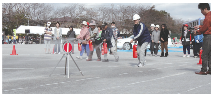
▲昨年の総合防災訓練 (湖北台東小学校)