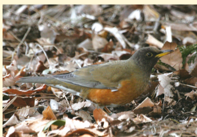
写真 中西 榮子(鳥の博物館友の会) 文 小田谷嘉弥(鳥の博物館学芸員)

静かな冬の林で「カサカサッ、カサカサッ」と、落ち葉の音がどこからか聞こえてきます。よく