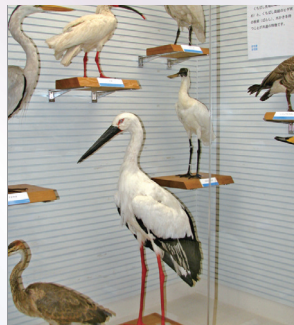
▲野生絶滅種のトキ、絶滅危惧種のコウノトリ、クロツヘラサギも展示