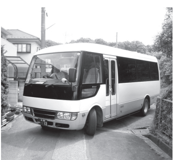
▲根戸ルートのおびバス

あびバス・根戸ルートの運行ルート・運賃が10月1日から変更となります。ルート変更に伴い、我孫子駅北口停留所の発着場所がセントラルスポーツ前に変更となりますのでご注意ください。