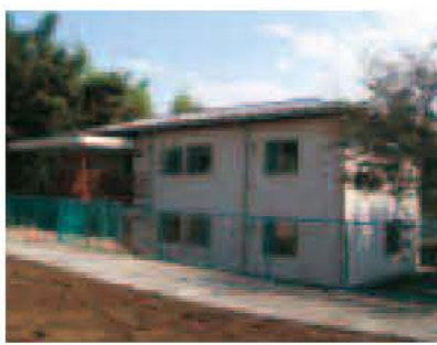
▶高野山小学児童保育室

少し大人の自分に出会える 手習の丘ふれあい宿泊通学 宿泊通学は他の学校の友だちと共同生活を送ることによって、自立心や協調性を育むことを目的に、年4回、市内全小学校の4、6年生を対象に2泊3日で実施しています。学校に通学しながら、放課後は違う学校の友だちと県立手習の丘少年自然の家で一緒に生活し、ナイトウォークや野外炊飯を行います。いつもは家族に頼る朝起き、食事作りなど身の回りのことも宿泊通学中は全て子どもたち自身で行います。参加した子ども