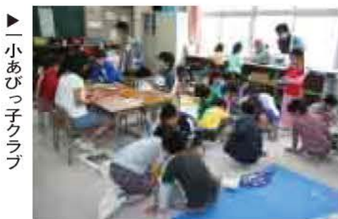
▶小あびっ子クラブ

市では、「子育て」「子育て」事業に積極的に取り組んでいます。今回は、小学生の放課後などを対象とした取り組みとして、子どもたちが安全・安心に自由に過ごせる場を提供する「あびっ子クラブ」と、保護者の就労と育児の両立を支援する「児童保育室」、子どもたちの生きる力を育む「宿泊通学」を紹介しています。 あびっ子クラブ、根戸小に10月16日(土)オープン! 市内2校目のあびっ子クラブが10月16日、根戸小学校にオープンします。「根戸小あびっ子クラブ」は、根戸福祉センター2階の旧根戸小学児童保育室第二がメインルームとなります。「あびっ子クラブ」は、「地域で子どもを育てる」子どもたちが安全・安心に遊べる。を基本に、学校の敷地内で放課後子どもたちが安心して自由に過ごせる場です。 モデル校である「小あびっ子クラブ」では、子どもたちが自分たちで遊びを作りあげ、のびのび過ごしています。また、お習字、お筆、ショートテニス、パターゴルフ、まりつきなど、地域の方たちがサポーターとなりさまざまな体験ができる「チャレンジタイム」も実施しています。 このような取り組みが評価され、同クラブは平成21年2月25日「第一回放課後子ども教室推進表彰教室」として文部科学省生涯学習政策局長から表彰。平成20年市が実施した「次世代法に基づく後期行動計画策定に