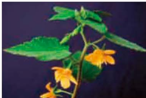
文・写真 佐久間 俊行

た雄しべが取り巻いています。また花弁の外側には反り返った五個の萼片も見えます。果実は細長く、長さは三〜四センチで、裂けると多くの種子を出します。