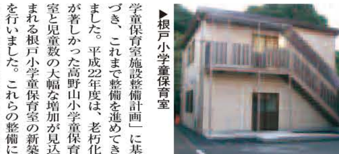
▶根戸小学児童保育室

我孫子市学童保育室は、待機児童ゼロを目標に「我孫子市児童保育室整備計画」に基づく大規模な施設整備は今年度で完了します。今後も、より質の高い充実した保育が運営できるよう保育環境の整備に努めていきます。 子ども支援課・内線449