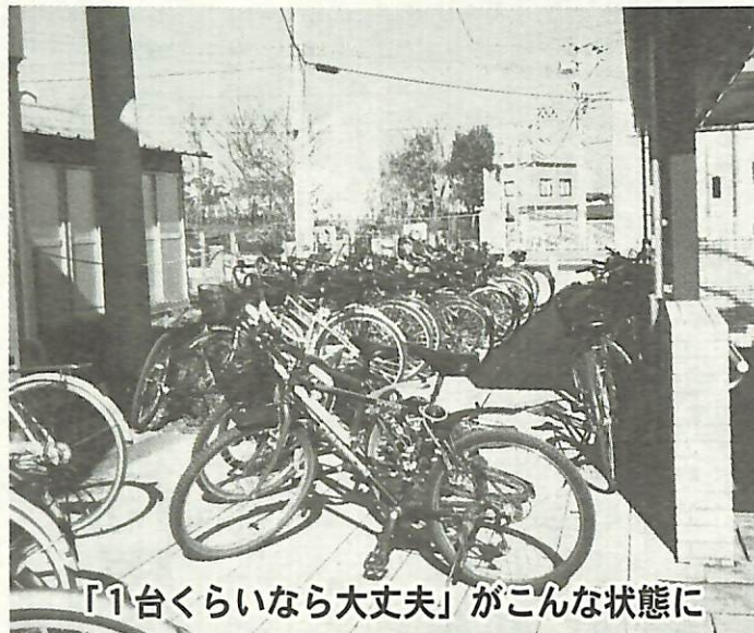
「1台くらいなら大丈夫」がこんな状態に