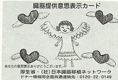
臓器提供意思表示カード あなたの意思表示ありがとうございます。 厚生省・(社)日本臓器移植ネットワーク ドナー情報用全国共通連絡先: 0120-22-0149

血病などで苦しんでいる人たちの命を救います。また、骨髄の提供とは別に臓器の提供をすることが出来ます。これは、本人と家族の意志をカードによって表示するもので、カードを携帯していれば、臓器を迅速に必要な方に提供できるのです。