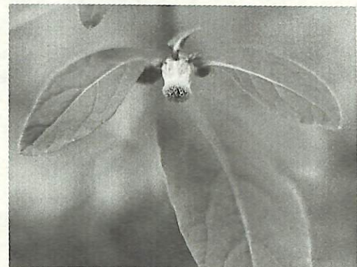
ガンクピソウ (きく科)

血病などで苦しんでいる人たちの命を救います。また、骨髄の提供とは別に臓器の提供をすることが出来ます。これは、本人と家族の意志をカードによって表示するもので、カードを携帯していれば、臓器を迅速に必要な方に提供できるのです。