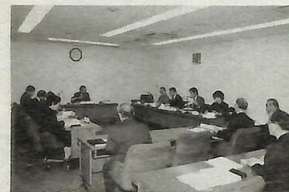
2月1日、行政改革市民推進委員会に「行政改革指針案」を諮問しました。(写真)

分権の確立は、まさに市民が主体となってまちづくりを推進することであり、行政と市民の相互理解と協力が何より大切なこととなります。地方分権の時代にふさわしい自治的・主体的まちづくりを担える市政を確立しなければなりません。このため私としては、引き続き、はじめに述べた3つの基本に沿って、市政の改革に全力をあげて取り組んでまいります。