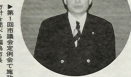
▶第1回市議会定例会で施政方針を述べる福島市長

今日、地方分権が時代の大きな流れとなっています。これは、開近に迫った21世紀を展望して、全国的な統一性を重視する中央集権型行政システムから、分権型行政システムへの転換を図ろうとするものです。住民に身近な施策は住民に直接接する地方自治体