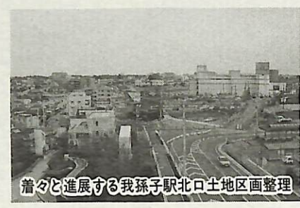
着々と進展する我孫子駅北口土地地区画整理

本年度は、本体工事の残り部分と濾材の充填、大和排水は、試験通水を行います。 〔人と鳥が共存するまちづくり計画〕 市役所内に「計画策定委員会」と「ワーキング会議」をつくり、現況の把握や先進事例の視察を行います。計画策定にあたっては市民アンケートや市議会との意見交換、市民、学識経験者による懇談会の開催等を行います。 〔景観形成〕 市民が参加する「まちなみウォッチング」を引き続き開催するとともに、