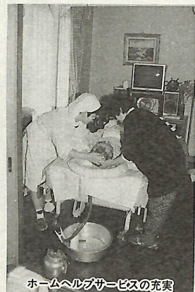
ホームヘルプサービスの充実

「手賀沼に堆積したヘドロの再利用」 電力中央研究所から、ヘドロを建築材料や水質浄化材、あるいは堆肥へ再生