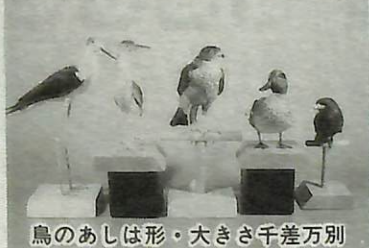
鳥のあしは形・大きさ千差万別

鳥の博物館では、第17回企画展「鳥の形とくらしII あしのはたらき」を開催します。今回は、昨年開催した企画展「鳥の形とくらしI 餌とくらし」に続くテーマとして鳥の「あし」を取り上げ、あしの形とくらしの関係を探りました。 展示では、①あしの働き ②あしの仕組み③あしの形と鳥のくらしの各テーマについて、はく製や骨格標本、写真パネルを使って紹介。また、新たに製作した可動模型により、あしの動きのメカニズムを解説します。ぜひ、ご覧ください。 ▼開催期間 3月5日(日)から7月16日(日) ▼問い合わせ 鳥の博物館(85)2212