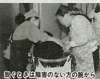
脱ぐときは障害のない方の腕から

自家製味噌は、来年3月頃出来上がり、鍋ものや味噌汁など料理の味を彩る材料に使われます。