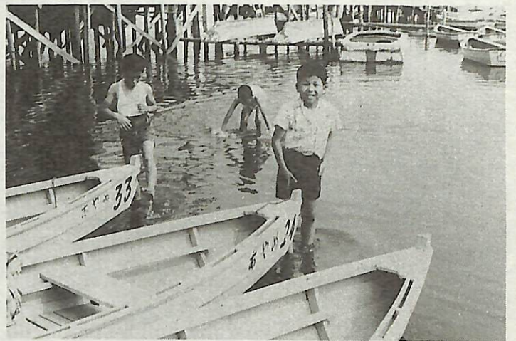
〈昭和40年頃の手賀沼公園付近：環境保全課資料より〉

昔の思い出の写真から当時の手賀沼を振り返ってみませんか。(このシリーズは毎月1日号に掲載しています)