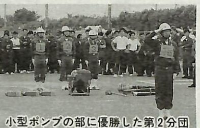
小型ポンプの部に優勝した第2分団

雲り空の6月12日(日)、消防団消防操法大会が日本電気駐車場で行われました。この大会は、火災などいざという時に迅速な行動がとれるかを競うもの。部大会に出場します。