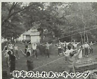
昨年のふれあいキャンプ

学校へ行かないで悩んでいる児童・生徒のみならず、自然の中で新しい仲間と一緒に生活し、いろいろな体験をしながら自分を鍛えてみませんか。 ▼日程 8月29日(日)から31日(火)、2泊3日 ▼場所 あすなろの里(茨城県水海道市)