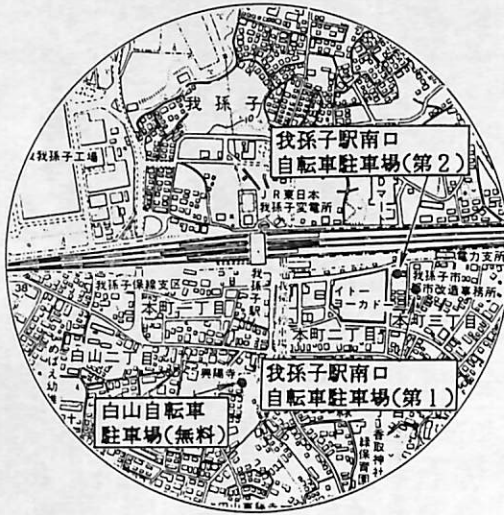
(上図は我孫子駅を中心とした半径500メートルのおよその位置です)

4月1日から新たに整備される我孫子駅南口自転車駐車場(左図参照)は有料化になります。有料化の理由は、自転車駐車場としての整備および施設の維持管理等に多大な費用を要するため、受益者負担の原則から、使用者の皆さんに費用の一部を負担していただくものです。