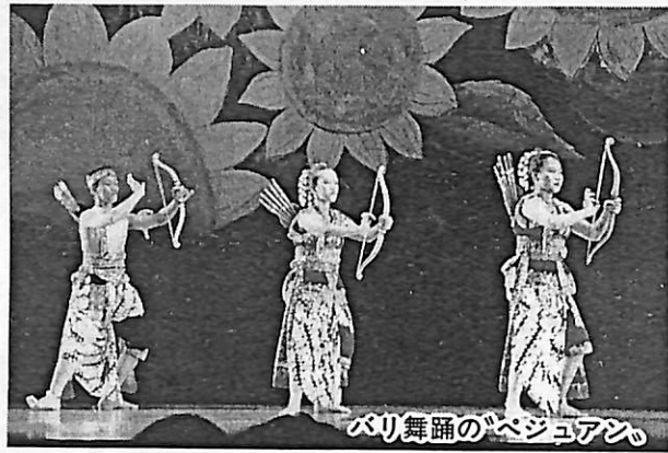
バリ舞踊のペジュアム

▶日時：3月7日(日) 午前10時から午後2時20分 ▶場所：市民会館(入場無料)