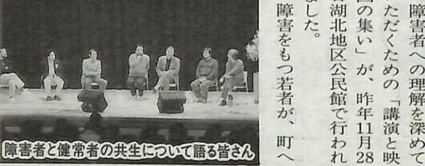
障害者と健常者の共生について語る皆さん

障害者への理解を深めて いただくための「講演と映 画の集い」が、昨年11月28 日湖北地区公民館で行われ ました。 障害をもつ若者が、町へ 来るときは、この映画の監督は じめ画家、歌手、厚生省・前 障害福祉課長、福祉施設の職 員が障害者と健常者の共生に ついて語り、福祉は特別なも のではない、様々なかわり 方があることを訴えました。 なお、集いの剰余金6万2 74円は、実行委員会から市 内の共同作業所に寄付されま した。