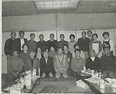
▲根戸近隣センターで行わ れた新年会 ▼町の街並み

と水道が引かれてなく、とて も不便でした。そこで、開発 業者や東京電力、市役所など へ何度も足を運び、やっとの 思いで実現したんです。本当 に苦労しましたよ。 活動としては、総会や役員 会などのほか道路やU字溝、 水路の清掃、空き地の草刈り も全員でやっています。1月 17日には、新年会を根戸近隣 センターで行い、大いに盛り あがりました。また、根戸地 区まちづくり協議会にも積極 的に参加し、他の自治会の皆 さんと協力して地域のまちづ くりを進めています。 課題はいくつかありますが、 町会を流れる水路は大雨にな ると、すぐあふれてしまうの で、下水道は一日も早く整備 して欲しいですね。