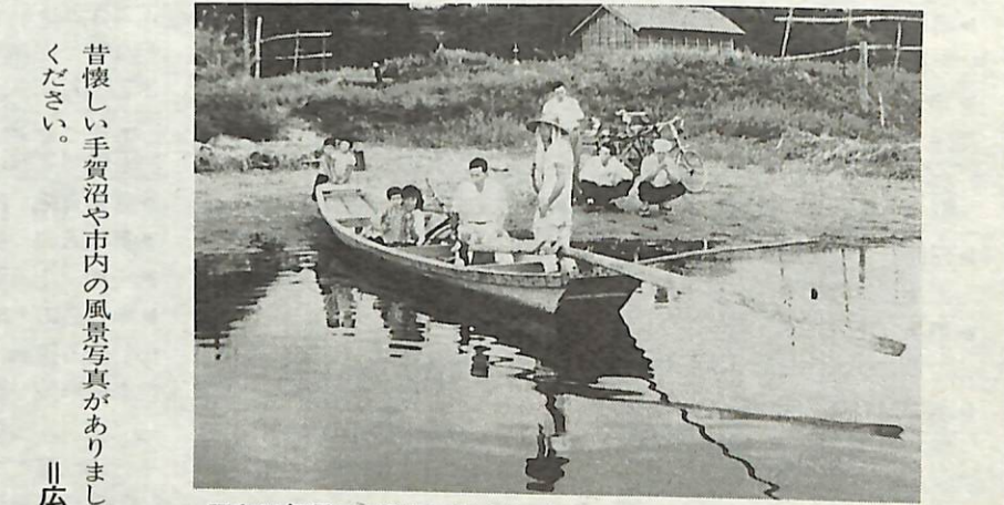
昭和28年頃の手賀沼の渡し船(現在の中里新田付近の渡し場) 昔の思い出の写真から当時の手賀沼を振り返ってみませんか。(このシリーズは毎月1日号に掲載しています)