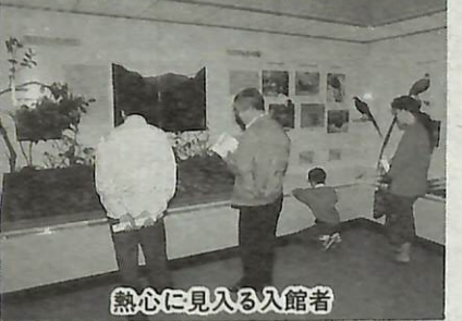
熱心に見入る入館者

鳥の博物館では、第11回企 画展「ヤマドリ展」いつまで も山谷にはばたけ」を開催中 です。既に多くの方が訪れて おり話題を呼んでいます。 企画展は4月11日(日)ま で開催。ご家族皆さんで、 ぜひご覧ください。