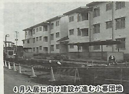
4月入居に向け建設が進む小暮団地

市内高野山の我孫子中学校の北側に建設が進められている小暮市営住宅及び我孫子B、都部団地の入居者を次のとおり募集します。 ▼募集内容 表Aのとおり ▼入居資格 ①市内に住所または勤務場所を有する方 ②現に同居し、又は同居しようとする親族があること(婚約者の場合は、入居の期限までに婚姻をした旨の証明が提出され、同居できることが確定である方。ただし、2DK程度以下の住宅については60 ③母子住宅入居希望の場合は、20歳未満の子供を扶養し、かつ市が発行する証明書の交付を受けていること ④身体障害者住宅入居希望の場合は、車いすを常時使用している身体障害者がいる世帯で、かつ身体障害者手帳の交付を受けていること ⑤現在、住宅に困窮していることが明らかなる方 ⑥国税又は、地方税を滞納していない方 ▼入居資格収入基準 表B及び表Cのとおり ▼募集期間 2月18日(木)から26日(金)まで ▼申込書配布期間 2月1日(月)から26日(金)まで ▼申し込みに必要な書類 (1)市営住宅入居申込書 (2)市営住宅入居調査書 (3)入居予定者全員の住民票