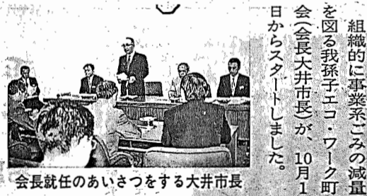
会長就任のあいさつをする大井市長

組織的に事業系ごみの減量を図る我孫子エコ・ワーク町会(会長大井市長が、10月1日からスタートしました。 町会は、市が市内事業所に呼びかけ、市を含む44事業所が参加して9月26日に発足。各事業所内から出るごみや資源の分別を徹底し、古紙や金属類などの資源回収を行ない、回収業者から得る売上金を環境保護や社会福祉に役立てていくものです。 今後、希望事業所は、生活環境課☎(8)0015へご連絡ください。