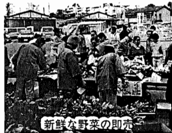
新鮮な野菜の即売

爽やかな秋、市内で生産された農産物を紹介し、農業技術の改善向上のため、産業まつり農業部門を行います。会場では新鮮な野菜等の即売もあります。ぜひ、来場ください。 日時 11月9日(土)、10日(日) 午前9時から 場所 中七公民館