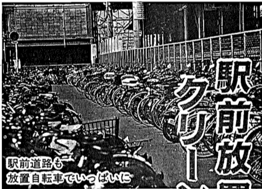
駅前道路も放置自転車

市内の公共施設などを見学し、市の現状を知っていただくとともに、皆さんの市政に対するご意見をお聞かせいただくため、施設見学会を開催します。今回は、クリーンセンター、市民図書館布佐分館、鳥の博物館、手賀沼水田広場、手賀沼(遊覧船)を市のバスで巡ります。 お気軽に参加ください。 ▼ 日時 11月15日(金) 午前9時30分から午後4時 ▼ 募集人数 40名(応募者多数の場合は抽選) ▼ 参加費 無料 ▼ 参加資格 市内在住者 ▼ 持参 昼食(弁当) ▼ 集合場所・時間 我孫子駅北口「ふれあい広場」午前9時20分 ▼ 申し込み・問い合わせ ハガキ(1枚に3名まで)に参加者の住所、氏名、年齢、電話番号、施設見学会参加希望と明記し、10月31日(木)必着までに我孫子1858市役所広報広聴課へ