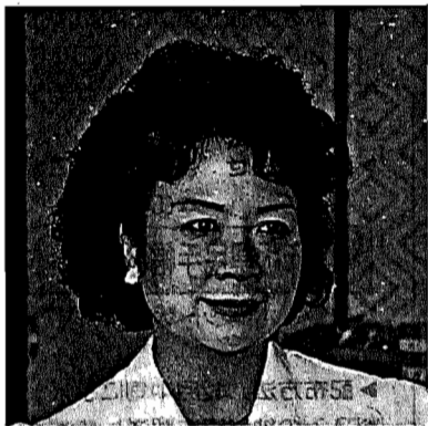
県内外国人女性100人のアンケートを小冊子にまとめた

「100人という数字は確かに少ないかもしれませんが、日本に住む他の外国人も同じような意見を持つている人は多いと思います。国際交流は、心と心の交流から始まるんじゃないでしょうか。多くの人にこの冊子を読んで欲しいですね。」