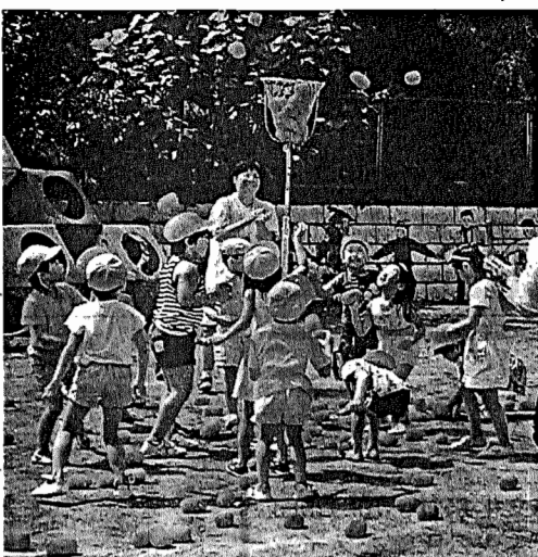
元気に遊ぶ子どもたち

来月4月1日、保育園への入園を希望される方は、11月1日(金)から22日(金)までに申請手続きをしてください。今回は、大切なお子さんを預ける保育園のあらしや入園申請について、Q&Aで紹介します。 Ⅱ 児童保育課