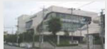
▲建物解体撤去条件付土地で売却する旧市民会館