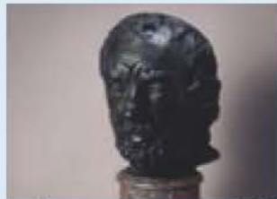
▲「鼻のつぶれた男」□ダンの作品