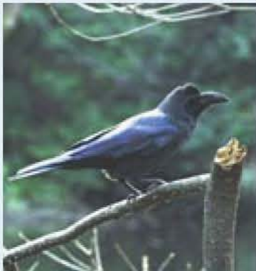
文 時田賢 (鳥の博物館学芸員)

ハシブトガラスは、アフガニスタンから東アジアにかけての広い地域にすみ、日本では留鳥として全国各地の高い山から都会までさまざまな場所にすんでいます。ゴミ箱の残飯から鳥の糞や卵、死んだ動物や魚など雑食性でとにかくなんでも食べるので、いろいろな場所で生活できます。