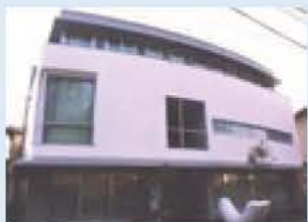
▲白樺文学館の建物正面

☎ 教育委員会文化課 ☎ 7185-1583、白樺文学館 ☎ 7169-8468