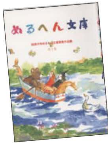
▲昨年刊行した第4集

市では、小・中・高校生が創作した童話の作品を募集します。受賞作品は、09年夏に刊行予定の「めめるへん文庫受賞作品集」に収録します。 なお、応募者の中で希望する方には、抽選で鳥の博物館ペア入館券をプレゼントします。 部門・応募資格 ◎小学生の部 ◎中学生の部 ◎高校生の部 平成2年4月2日から平成5年4月1日生まれの方