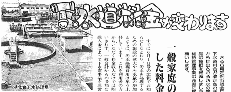
湖北台下水道処理場