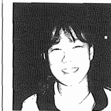
湖北台在住。県立桜ヶ丘養護学校2年。寮生活を守る。17歳。