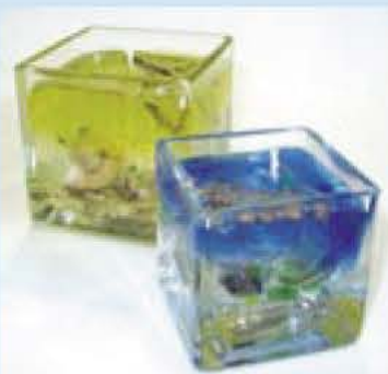
ジェルの中に何を浮かべようかな

申し込み ハガキかファクスで「冬の子ども工作」、応募者全員(兄弟・友達との連名応募可)の住所・氏名・学年・電話番号を明記し、11月29日必着で〒270-1147若松26の4我孫子地区公民館 ☎7165-6088へ 電話 我孫子地区公民館 ☎7182-0511