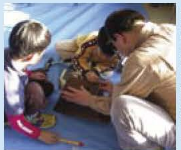
鳥の博物館「巣箱教室」より

日時 11月25日(日)午前10時から正午 場所 アピスタ 工芸工作室 定員 先着30人(小学校3年生以下は保護者同伴) 費用 600円 持ち物 軍手、かなづち、ドライバー、きり(お持ちの方)