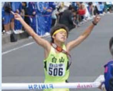
▲つないだ力 みごと開花

10月13日、秋の晴れ間が時折顔をのぞかせる絶好の駅伝日よりのなか、第61回東葛駅伝が開催されました。