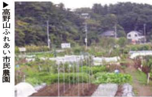
高野山ふれあい市民農園

市ファミリーサポートセンターは、子どもを持つすべての方が安心して子育てができる環境をめざし、子どもたちの成長を地域の皆さんで見守り応援して下さる提供会員を募集します。 同センターは、子育ての手助けをして欲しい方とお手伝いをしてほしい方が、会員となって運営する住民参加型の互助援助組織です。 対象 市内在住で、子どもが好んで心身ともに健康な方 ※資格・経験は問いませんが、事前研修を受けていただきます。 報酬 子ども1人につき、1時間700円（月曜日から金曜日の午前6時から午後10時）、900円（土・日曜日、祝日、年末年始） ※送迎の交通費や提供会員が用意する食事代などは利用会員の実費負担になります。 入会金 1000円 対象児童 6カ月から10歳未満 申し込み 電話かファクスで我孫子市ファミリーサポートセンター ☎ FAX 7186・416 1へ（月曜から土曜日の午前9時から午後5時）