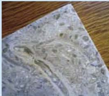
化石が見つかったタイル

対象・定員 小学生以上、材料がなくなり次第終了 参加費 無料(ただし高校生以上は入館料が必要) 申し込み 不要 鳥の博物館 ☎7185-2212