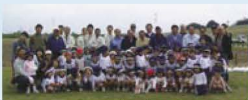
▲ロータリークラブと白ばら幼稚園のみなさん

レンゲの種と肥料は、我孫子ロータリークラブからご寄付をいただき、種まきはロータリークラブメ