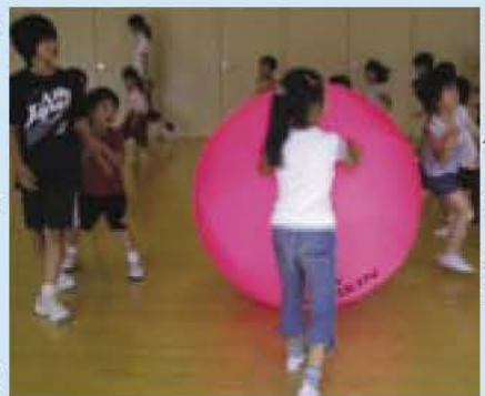
ボールを使った達人教室

申し込み・電話かファクスかEメールで「教室名」、氏名、学校名、学年、電話番号を明示し、社会教育課 ☎7185-1604 FAX7182-5867 Eメール syakaiku@city.abiko.chiba.jp