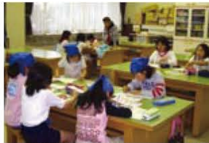
▲みんなでやれば宿題もはかどる!?

手賀の丘ふれあい宿泊通学は、複数の小学校の初めて出会う子ども同士が共同生活をしながら学校に通います。