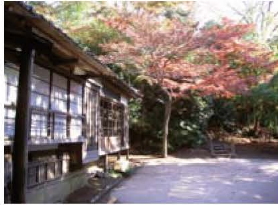
▲旧村川別荘(寿2丁目)

◎相談先 我孫子警察署生活安全課 ☎ 7182-0110、千葉県警察本部相談サポートセンター ☎ 043-227-9110 (短縮ダイヤル# 9110 (IP電話は除く))