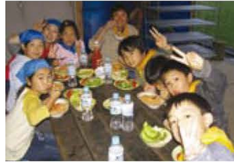
▲野外で作った自慢の晩飯

また、竹内神社から布佐駅東側、北千葉揚排水機場までの区域の道路も、神輿や山車の通過の際は片側通行になります。ご迷惑をおかけしますが、現場での指示に従い、安全通行にご協力ください。