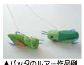
▲バッタのルアー作品例

バッタのルアーを作ってバッタ釣りをしてみませんか。バッタは自分に似た形のものを近づけると、仲間だと思って飛びついてきます。9月29日(土)には、バッタ釣りのイベントの自然観察会が行われます(詳しくは、広報あびこ9月16日号をご覧ください) 日時 9月15日(土)午後1時30分から3時30分 場所 鳥の博物館 対象 小学生以上 参加費 無料(ただし入館料がかかります。小、中学生は無料。材料が無くなり次第終了) 申し込み 不要 圖 鳥の博物館 ☎7185-2212