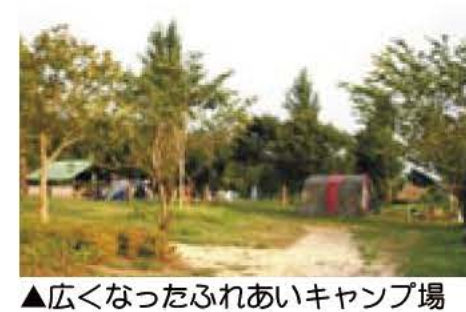
▲広くなったふれあいキャンプ場

日時 9月30日(日)午前10時から午後1時30分(雨天中止) 場所 ふれあいキャンプ場 内容 野外料理(鉄板焼き、網焼き、煮込み料理、飯ごう炊飯、デザート)づくりと会食 定員 10家族(1家族4人まで) ※応募者多数の場合は抽選。 参加費 1家族1500円 持参 ビニールシート、はし、スプーン、皿 申し込み ハガキまたはEメールで「家族で野外クッキング」、参加者全員の氏名(お子さんは学校名・学年・年齢)、住所、電話番号を明記し、9月14日必着で〒270-1166我孫子1684教育委員会社会教育課 Eメール syakakaiyouiku@city.abiko.chiba.jp / city.abiko.chiba.jp 教育委員会社会教育課 ☎7185-1604