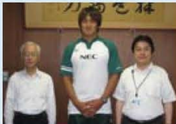
▲表敬訪問した熊谷選手

このワールドカップに日本代表選手として、我孫子市を拠点に活動しているNECのラグビーチーム「グリーンロケッツ」から5人が選出されました。