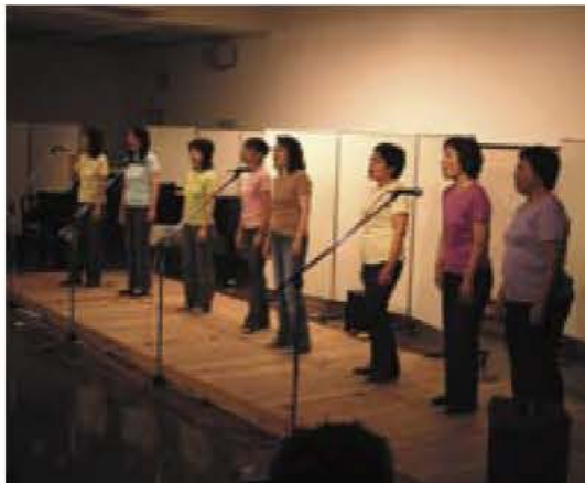
▲アカペラによるビートルズナンバーの歓迎ライブ