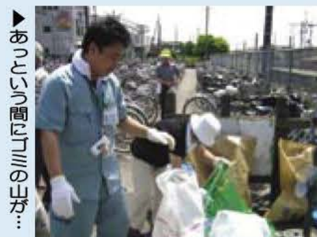
▲あびこ市周辺の山が...

ごみのないきれいな街にしようと、5月27日(日)ゴミゼロ運動が市内各地域で行われました。