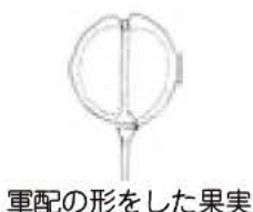
軍配の形をした果実

五月下旬に、我孫子駅北側の道路沿いで、花と実をつけたマカダミアナズナを見かけました。この草は北アメリカ原産の二年草で、日本には明治の中頃渡来したといわれます。