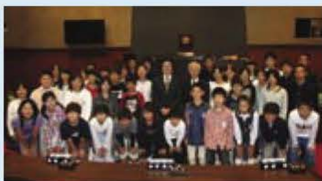
▲市長・教育長を囲む子ども議員の皆さん

市では、子どもたちの意見や要望を聴こうと、5月16日(木)と30日(木)の二日間、子ども議会を開きました。