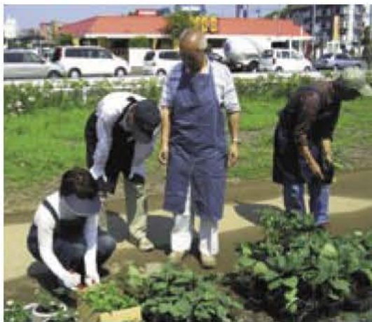
▲当日発表される、地域での活動体験の様子

◎地域での活動を一定期間、体験できるプログラムです。当日は、市の担当者が体験先の案内と相談を受け付けます。