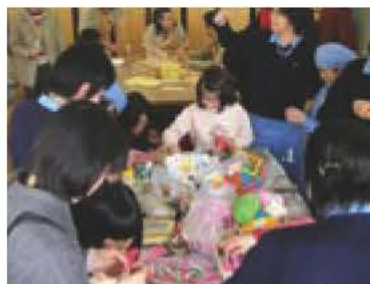
▲昨年のフェア(おもちゃ作り)

市民活動フェアは、地域課題に取り組みボランティア活動や市民活動を多くの市民に知っていただき、参加意識や支援者・理解者を増やすことを目的に開