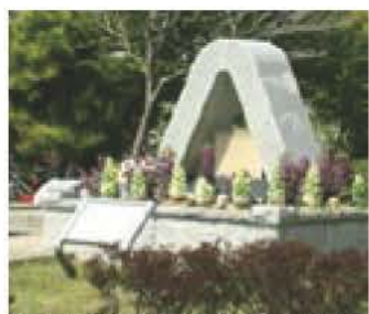
▲式典が行われる平和の記念碑

日時 8月20日(土)午前10時 場所 「平和の記念碑」前(手賀沼公園内) (雨天実施) 内容 献花と黙とう 主催 我孫子市原爆被爆者の会、我孫子市