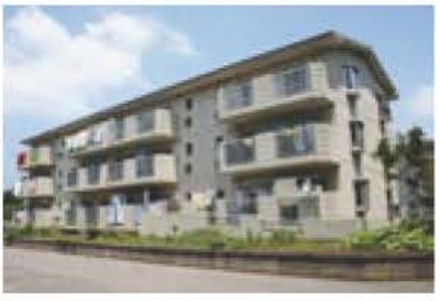
▲今回募集する根古屋市営住宅

入居資格 次のすべてに該当する方 ◎市内に在住・在勤の方 ◎住宅に困窮している方 ◎市税を滞納していない方 ◎同居または同居予定の親族がある方 ※単身者は、条件(年齢が50歳以上ほか)により入居可能 入居資格収入基準(月額) ◎一般世帯...20万円以下 ◎高齢者・障害者の世帯...26万8000円以下 申込書配布・受付期間 6月16日(木)から7月6日(水)