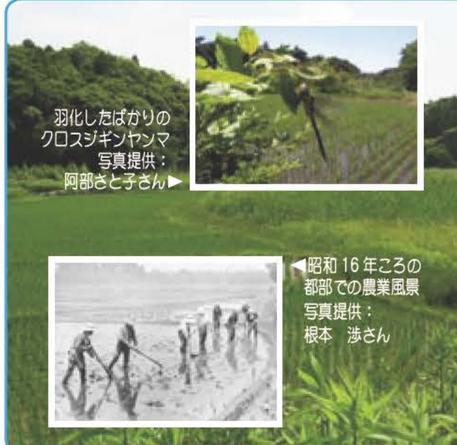
羽化したばかりのクロスジギヤンマ

年齢、電話番号、撮影場所、撮影月、題名を明記したものを貼付 ④デジタルカメラを使用した作品は、その旨を裏面に明記。合成、加工などの編集がされていないものに限ります ⑤撮影時期は問いません ※昔の谷津の写真をお持ちの方もぜひご応募ください。⑥作品は谷津に関する刊行物などに使用する場合があります 応募方法 7月29日(金)必着で〒270-1192市役所手賀沼課(住所省略可)へ郵送または持参 主催 我孫子市岡発戸・都部谷津ミュージアムの会、我孫子市 圓 手賀沼課・内線462、465