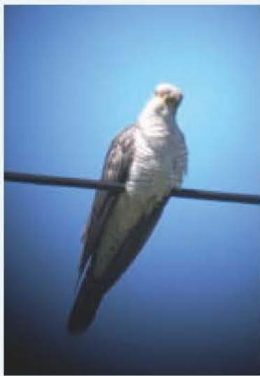
文 塩田 いづみ(鳥の博物館学芸員)

その名の通り「カッコウ・カッコウ」と特徴のある声で鳴く鳥です。日本には夏鳥として渡来し、我孫子では利根川沿いのヨシ原近くで見られます。姿は見つけられなくても声ですぐにカッコウとわかります。 主に昆虫を食べ、他の鳥が見向きもしない毛虫も好んで食べます。 カッコウには托卵(たくらん)という習性があります。托卵は自分で巣を作らず、他の種類の鳥の巣に卵を産み、卵やヒナの世話をその親にそのいっさいをまかせてしまう習性です。カッコウの托卵相手としてはオオヨシキリのほか、モズ、オナガなども知られています。カッコウのヒナは他の卵より早く孵化(ふか)し、他の卵やヒナを背中に乗せて外に出してしまします。