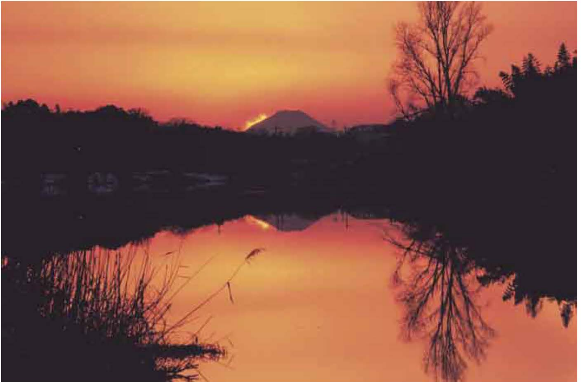
古利根沼に写る「逆さ富士」