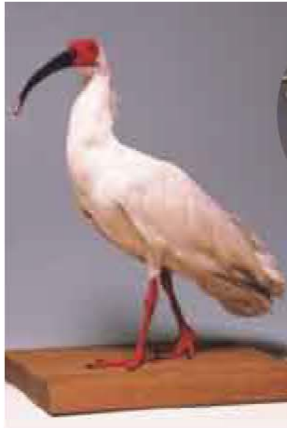
▲かつてはトキも我孫子の空に

教育委員会では、市内の小・中学校に勤務する英語指導助手を募集します。 対象・定員 英語を母国語とする外国籍の方で、大学の学士号以上の資格を持ち、日本での英語教育に熱意があり、日本語での日常会話ができる方、2人 選考日 1月28日(金) 申し込み・問 ハガキに英語または日本語で氏名、性別、年齢、住所、電話番号、国籍を明記し、1月21日必着で〒270-1166 我孫子市我孫子1684 教育委員会指導課 ☎04-7185-1367 へ