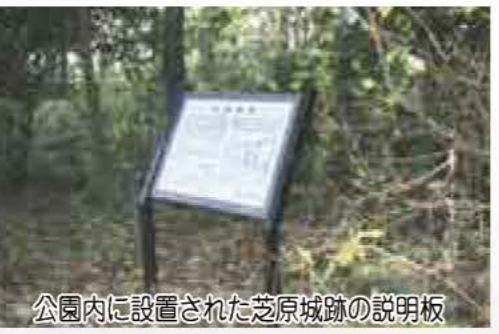
公園内に設置された芝原城跡の説明板

芝原城は、中峠城ともいわれ、古利根沼の南側の台地にありました。 戦国時代には河村氏の居城であったとされ、北条氏の滅亡の時に廃城したといわれています。