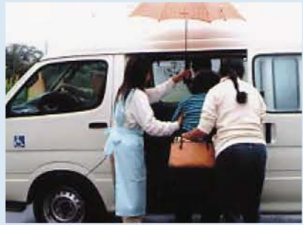
高齢者のお出かけを介助する「まごころ」の皆さん

地域の課題に着目し、高齢者が快適に生活するためのお手伝いすることを目的として設立されました。そして10月1日に「訪問介護ステーションまごころ」を開設しました。