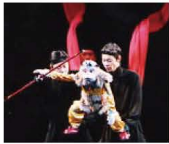
▲孫悟空を生き生きと操る人形使い

子ども優先席あり) ※10人分の入場券購入者に1人分の付添券が付きます。(教育委員会で購入した方のみ) ※10人以上の市内の団体で送迎希望の場合は文化課へ申し込みを。(定員になり次第締め切り) 入場券販売所 教育委員会、ブックインひらが、市民会館内売店ひろがり、荒井書店、東京事務器、写真のおちあひ