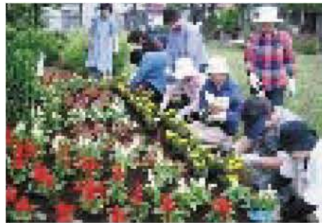
つくし野2号公園の花壇づくり(5月)

や種、肥料、レンガ、材木などを提供するほか、草刈り機や電動のこぎりなども貸し出します。