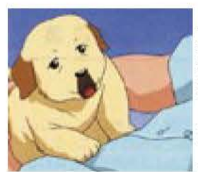
盲導犬クイールの生

今年4月に以降に購入した16ミリフィルム(アニメ作品)を上映します。 日・場所 11月21日(日)午前10時20分から正午、高野山小学校地域交流教室(参加無料) 内容 盲導犬クイールの一生、いのりの手、まるちゃん社会科見学に行く 対象・定員 小・中学生、先着30人 ※地域交流教室には駐車場はありません。