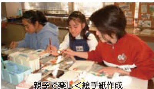
親子で楽しく絵手紙作成

今静かなブームになっている絵手紙。この絵手紙の技法で、すてきな年賀状を作ってみませんか。親子で楽しいひとときを