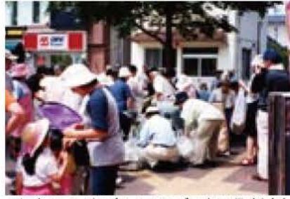
▲汗をぬぐいながら多くのごみを回収(昨年)

我孫子市さわやかな環境づくり条例は、ごみのポイ捨て禁止や資源の再利用促進などを定めています。また、5月を「さわやかな環境月間」としています。市では、「ごみゼロ運動」をはじめ、「自動車のアイドリングストップ推進キャンペーン」などさまざまな取り組みを行います。また、環境美化や再資源化の活動を積極的に推進している個人または団体に「さわやかな環境づくり賞」を贈ります。