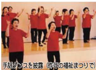
手話ダンスを披露(昨年の福祉まつりで)

障害のある方も、高齢の方も、大人も子どもと一緒に楽しみ、福祉について体験し、知ることができます。ぜひご参加下さい。