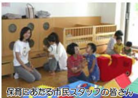
保育にあたる市民スタッフの皆さん