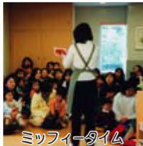
ミッフィータイム

3歳以下のお子さんと保護者がいっしょに楽しむ「ミッフィータイム」と、4歳から9歳くらいまでのお子さんのための「パーバタイム」があります。