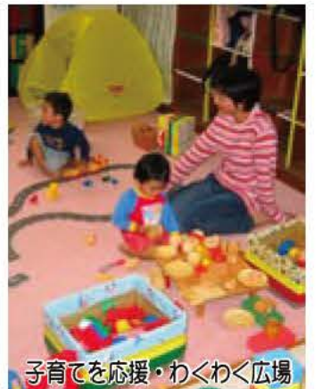
子育てを応援・わくわく広場

計画の策定は、公募の市民や学生を含む市民と子どもに関係する市職員合わせて26人で構成