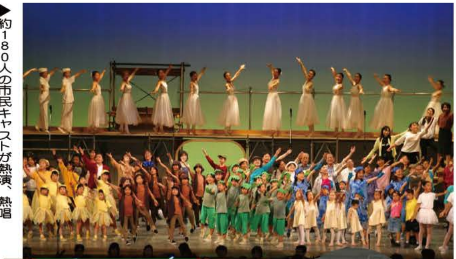
約180人の市民キャストが熱演、熱唱