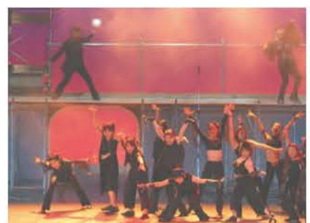
悪役のカラス軍団