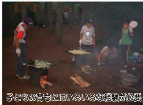
子どもの育ちにはいろいろな経験が必要

なぜ、いま子ども総合計画を策定するのか 市では、現在、子どもに関する総合的な計画づくりをすすめています。