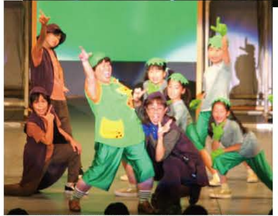
▲物語を盛り上げたカッパ、ウナギなど沼の仲間たち