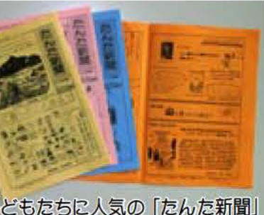
子どもたちに人気の「たんだ新聞」

10月1日(水)から、我孫子市と取手市が図書館の相互利用を開始し、我孫子市民も取手市立図書館で本を借りることができるようになります。 ※利用方法など詳しくは、取手市立図書館 ☎ 0297-748361へ ※取手市立図書館の利用カードを作成する際には、身分を証明するもの(運転免許証、健康保険証、学生証など)が必要。 我孫子市立図書館 ☎ 71841110