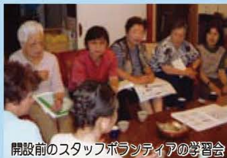
開設前のスタッフボランティアの学習会