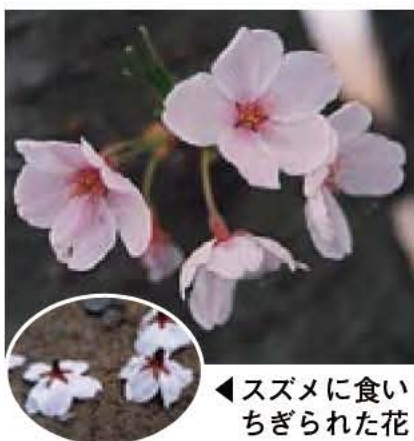
◀スズメに食いちぎられた花

皆さんとまちなみを探索しながら、我孫子らしい景観を一緒に考えつくり出すため、「まちなみウォッチング」を行います。今回は、布佐地区で歴史・文化を訪ねるとともに、建築・緑化協定に守られた美しいまちなみを楽しみながら、景観づくりについて考えます。 日時・場所 6月7日(土)午前9時45分布佐駅南口集合、午後2時25分同駅で解散予定(小雨実施、荒天の場合は8日に順延)コース 布佐駅→稲荷神社→相島新田・井上邸→浅間神社→宮ノ森公園(昼食)→竹内神社→勝蔵院→延命寺→布佐駅(行程約6km) 定員 先着30人 参加費 無料 持参 昼食、飲み物 申し込み・電話で都市計画課・内線578へ ※開催の有無は、当日の午前7時からテレホンガイド ☎7185・5000 コード番号849でお知らせします。