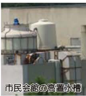
市民会館の高置水槽

マンション・ビル・病院などの水道は、その多くが貯水槽水道(受水槽や高置水槽)を通じて給水しています。 このような施設では、管理が十分でないとう水道水が汚れる可能性があります。 受水槽に入るまでの水道は水道局が管理していますが、受水槽以降は、その設置者(建物の所有者等)が管理することにな