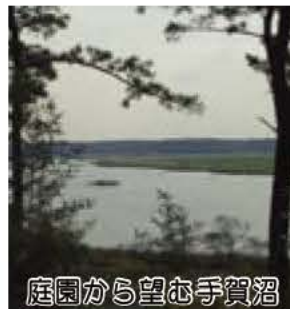
庭園から望む手賀沼

場所 市民プラザ 内容 左表参照 受付時間 午前10時から午後7時(毎月第2・3木曜日休館) ※詳しくは、市民プラザに用意したパンフレットとスケジュール表をご覧ください。 ◎ 市民プラザ ☎ 7183-2111