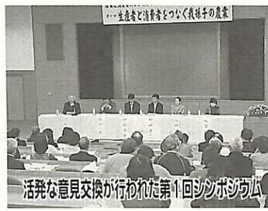
活発な意見交換が行われた第1回シンポジウム

場所 あびこショッピングプラザ駅前店頭 会場 (共進会表彰式のみ市民プラザ) 問い合わせ 農政課☎(85)1111内線511