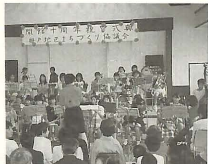
根戸近隣センターで、10月1日(日)、開館10周年祝賀式典とたのしいイベントが行われました。

根戸近隣センターは、10月1日(日)、開館10周年祝賀式典とたのしいイベントが行われました。 同近隣センターは、「根戸地区まちづくり協議会」が市などから披露され、見学者から大きな拍手を受けていました。 祝賀イベントでは、日舞、マジックショー、落語、根戸小学校児童による吹奏楽(写真)、久米中学校生徒の有志によるフォークソングの演奏が行われました。