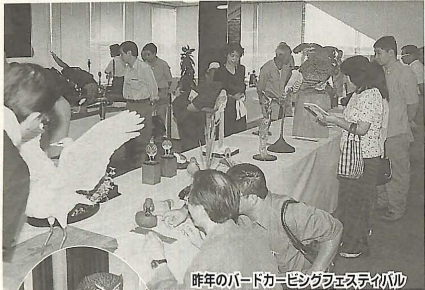
昨年のバードカービングフェスティバル

「バードフェスティバル2000」が開催されます。昨年までは「全日本バードカービングフェスティバル」として開催していましたが、今回から、鳥とおして自然や環境について関心を持っていただくイベントとして規模を拡大し、市民団体などの鳥をモチーフとした催しをより充実させて実施します。