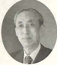
故・山階芳麿博士

財団法人山階鳥類研究所では、創設者・山階芳麿博士の生誕100周年記念講演会と今年度の山階芳麿賞授賞式と記念講演を行います。