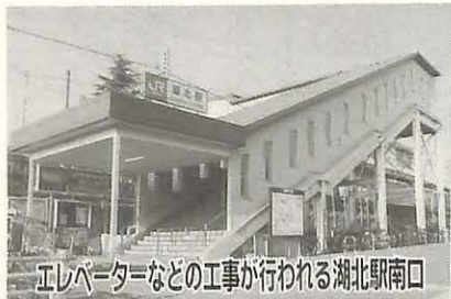
エレベーターなどの工事が行われる湖北駅南口

市では、人にやさしいまちづくりを進めています。すべての市民が安心してまちなかを移動できるよう、駅入口階段へのエレベーターやエスカレーターなどの設置、歩道の段差解消や点字ブロックの設置などを計画的に進めています。また、目の不自由な方などの外出を手助けするため、音声誘導装置を県内で初めて導入しました。