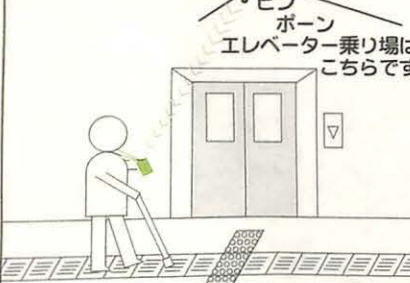
①音声ガイド装置に近づくと、小型送信機がピピピと鳴ります。