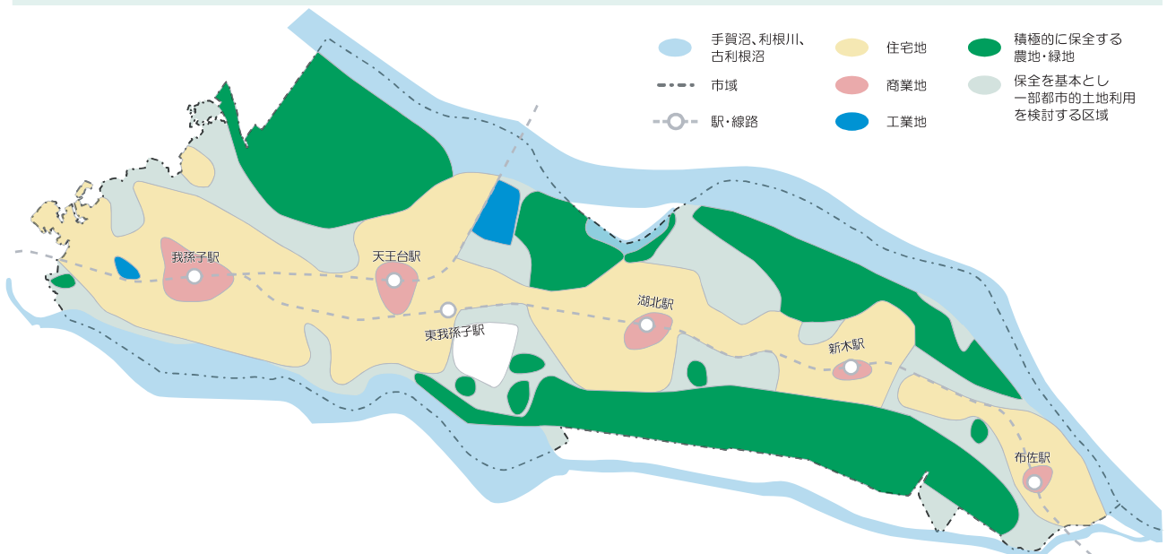
■土地利用の基本方針

また、この方針に沿った土地利用を確実なものとするよう、関係法令や市独自の土地利用誘導施策の適正な運用や指導を図りながら、総合的・計画的な土地利用を進めます。