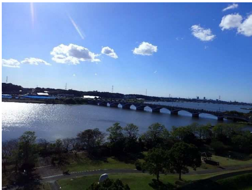
手賀大橋と手賀沼

手賀沼をはじめとした水辺や豊かな里山が残る谷津ミュージアムは、市の貴重な財産であり、これらを適切に保全・管理していくことが必要です。市民の目に映る緑を増やし、自然豊かな水辺空間や貴重な生き物を保全し、自然と共に生きるまちづくりを目指します。