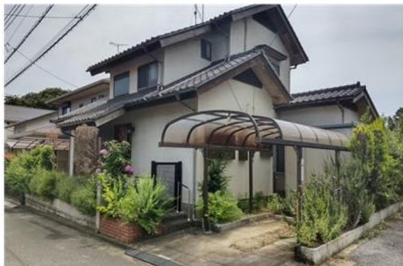
2Fからの見晴らしが良く、開放的です♪

角地 高台で2階からの眺望よし 日当たり良好 広い土地「約78坪」 広い庭 カーポート有 窓が多く開放的 住環境よし 近くに総合病院あり [木戸公園]・隣 浴室はリフォームして、とても綺麗。 システムキッチンその他 収納スペース多数 閑静住宅地 周辺は、綺麗な街並みです。