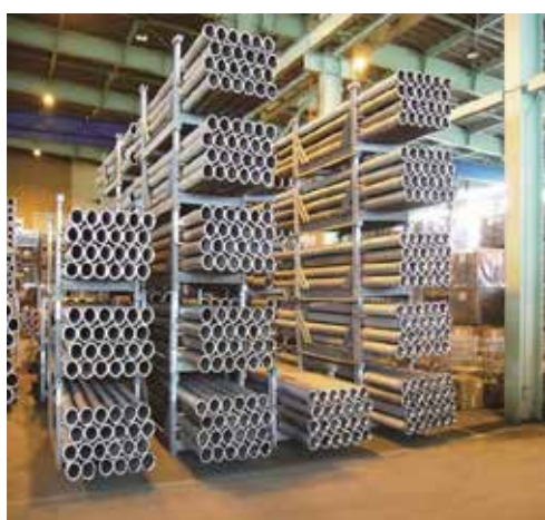
緊急資材保管状況

この備蓄システムは、豊富な仮設配管資材が市外の保管場所(茨城県稲敷郡河内町)に常時ストックがあり、緊急要請に対して24時間365日受付され、優先的に供給を受けることができることから、応急復旧工事の速やかな着手が可能となります。