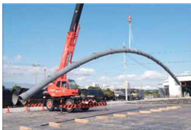
管路の挙動確認試験(ダクタイル鋳鉄管)