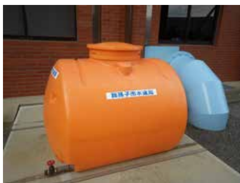
6基 (容量 1m 3 /基)