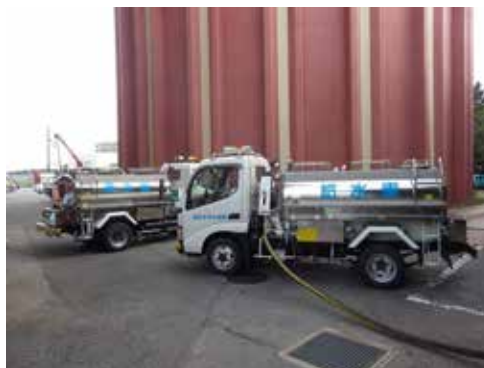
2台 (水積載量 2m 3 /台)