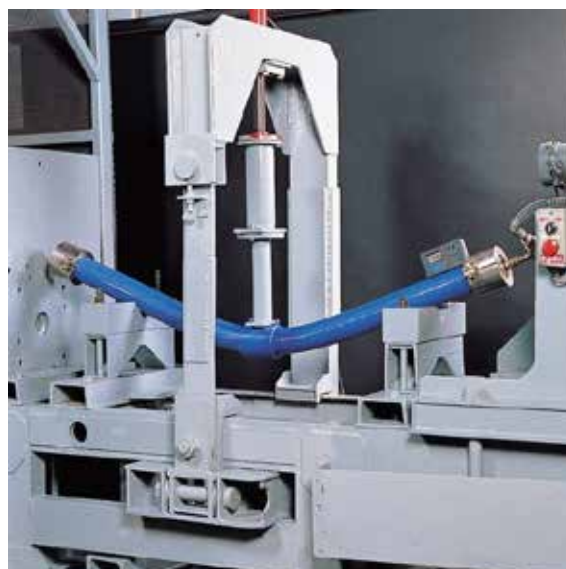
曲げ水圧試験(配水用ポリエチレン管)