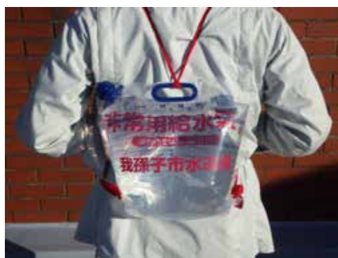
6リットル用(背負い式)