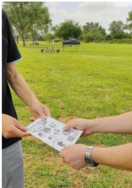
Phát tờ rơi nâng cao nhận thức