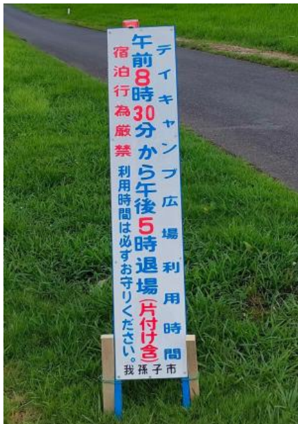
Bảng hiệu lắp đặt

Ngoài ra, còn có biển báo ở lối vào và lối ra của bãi đậu xe của quảng trường cắm trại ban ngày. Xin lưu ý rằng quảng trường không được sử dụng để lưu trú qua đêm.