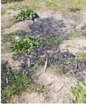
Than củi bị loại bỏ