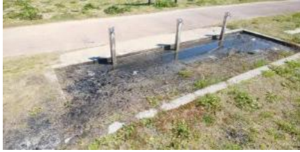
물장에 숯이 버림받고 있는 상태