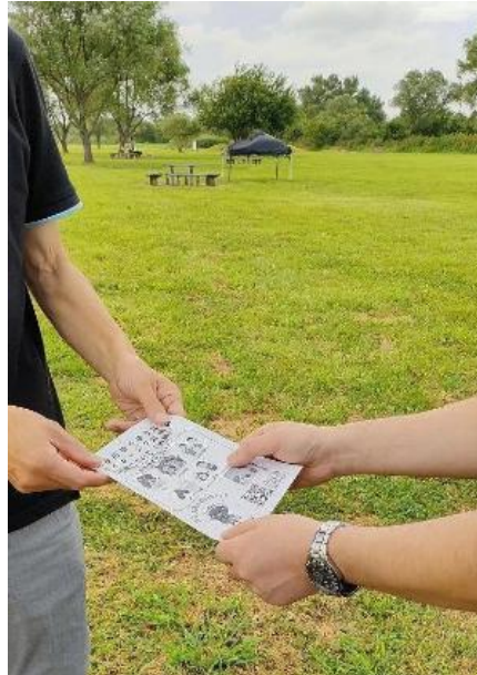
启发传单散发的情况