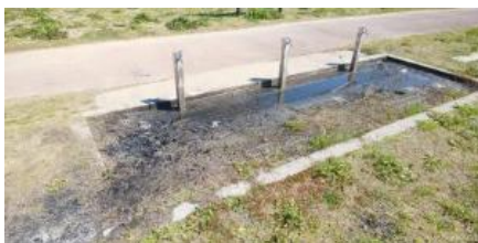
被饮水站炭扔掉的情况