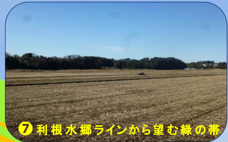
⑦ 利根水郷ラインから望む緑の帯