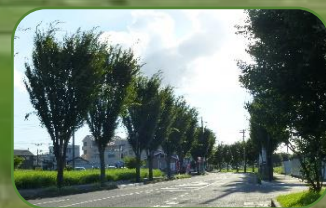
④ 葦不合神社 ⑤ 新木駅北側付近の樹林地 ② 広大な手賀沼干拓地を望む ① 「やすらぎの道」の並木

我孫子のいろいろ八景歩き 新木・古戸の古社と里を巡るコース 発行者 我孫子市都市計画課景観推進室 ☎04-7185-1111 (代表)