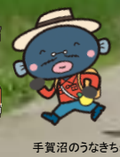
オオバンくん 手賀沼のうなぎちゃん