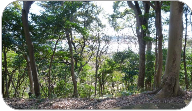
12 根戸船戸緑地から見える手賀沼