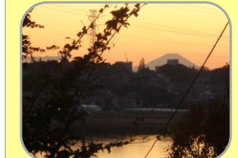
富士見坂から見える 富士山