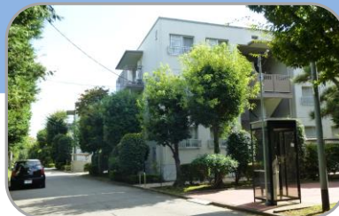
7 白山グリーンタウン