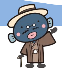
手賀沼のうなぎちゃん

我孫子のいろいろ八景歩き 白山のまちなみと船戸の森・湧き水の小径コース 発行 平成28年10月 第1刷発行 令和4年10月 第4刷発行 発行者 我孫子市都市計画課景観推進室 ☎04-7185-1111 (代表) 企画・編集 我孫子の景観を育てる会