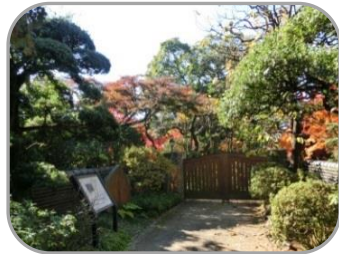
11 旧武者小路実篤邸跡