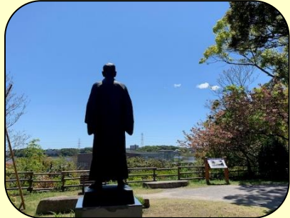
13 天神山緑地から手賀沼を望む 嘉納治五郎の銅像