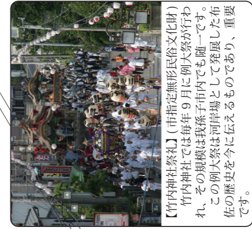
【竹内神社祭礼】(市指定無形民俗文化財) 竹内神社では毎年9月に例大祭が行われ、その規模は我孫子市内でも随一です。この例大祭は河岸場として発展した布佐の歴史を今に伝えるものであり、重要です。

我孫子市の東部、布佐地区は手賀沼と利根川とが合流する地域で、今の布佐平和台に位置する布佐余間戸遺跡では縄文時代でもかなり早い段階から人が住んでいました。また、江戸時代の利根川は、関東一円の水運の大動脈であり、布佐地区はその要衝である河岸場として大いに栄え、手賀沼や利根川に関する我孫子遺産が多く残っています。