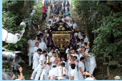
上：竹内神社祭礼の様子 左：寿防犯ステーション横にある子の神への道しるべ