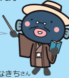
手賀沼のうなきちゃん