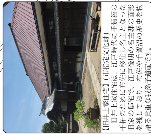
【旧井上家住宅】(市指定文化財) 旧井上家住宅は、江戸時代に手賀沼の干拓のために布佐に移住した名主となった旧家の邸宅で、江戸後期の名主の面影を残しており、布佐や手賀沼の歴史を語る貴重な我孫子遺産です。