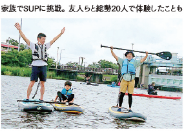
家族でSUPに挑戦。友人らと総勢20人で体験したことも

手賀沼は水辺の街・我孫子の象徴。ヨットやカヌーなど、水のアクティビティはもちろんのこと、周辺はキャンプ場も数多く点在。週末はアウトドアを楽しむ家族で賑わいます。沼に沈む夕日も一見の価値あり。