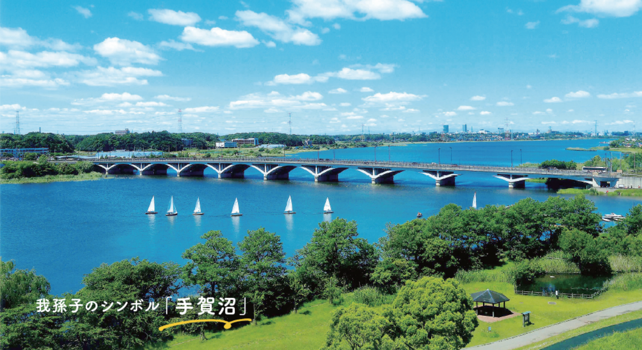
我孫子のシンボル「手賀沼」