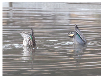
③水底に首を伸ばして採餌するコガモ