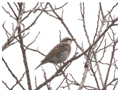
④木の上に群れていた冬鳥のツグミ