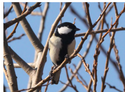
⑤さえずっていたシジュウカラ ※当日は撮影できなかったため別の日の写真