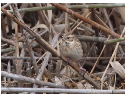
⑦ヨシの中で採餌するオオジュリン