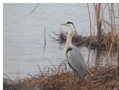
⑧遊歩道に近いところで休息していたアオサギ