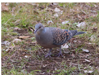
⑥地面に落ちた木の実を食べるキジバト