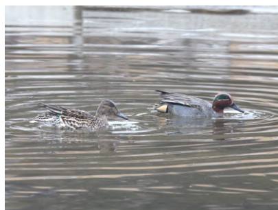
②冬鳥のコガモ(右がオス、左がメス)