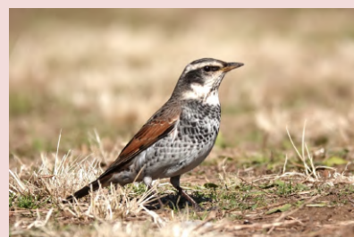
ツグミは胸を張り背筋を伸ばすような姿勢をすることが多い。

ツグミは夏にロシアなどで繁殖し、秋から冬にかけて越冬のために日本へやってくる小鳥です。我孫子では10月頃から5月頃まで観察することができます。渡ってきたばかりの頃は樹上でカキの実やハゼノキの実をよく食べますが、木の実が減ってくる1~2月頃からは地面に降りてミミズや昆虫の幼虫を食べることが多くなります。同じように地面で採餌するムクドリやハクセキレイは足を交互に出して歩きますが、ツグミは足を揃えてピョンピョンと跳ね歩くため、慣れれば動きを見るだけで遠くからでも見分けることができます。