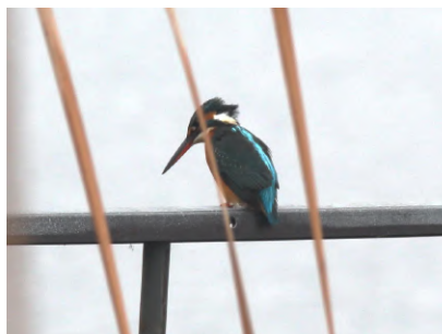
①魚を狙っていたカワセミ