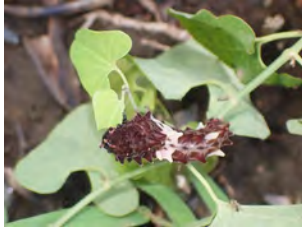
①ウマノスズクサの葉を縁から食べていたジャコウアゲハの幼虫