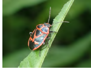
③ボントクタデの葉上のナガメ