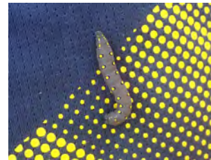
⑧ヤブガラシの葉を食べていたセスジズメの幼虫