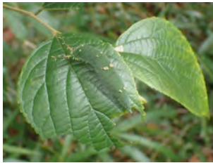
⑤エノキの葉を縁から食べていたアカボシゴマダラの幼虫