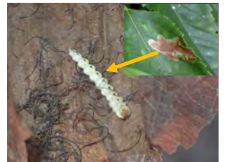
⑥茶色く変色したムクノキの葉の中に潜っていたナミガタチビタマムシの幼虫