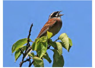
⑩樹上でさえずっていたホオジロ