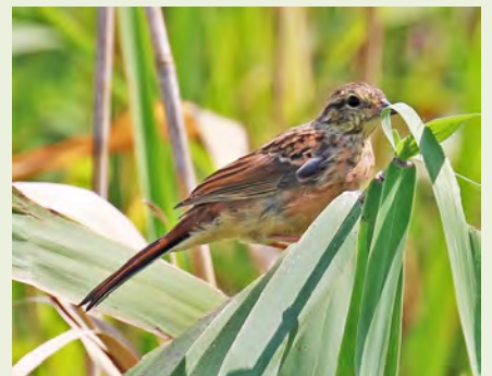
手賀沼周辺で見られたホオジロの幼鳥

ホオジロは、全国の山地から平地の草地に広く生息しています。手賀沼周辺では一年中見られ、4月から7月の繁殖期には、オスがさかんにさえずり、なわばりを主張します。一番高くて目立つところでさえずるので、声のする方向を探せばその姿を見つけることができます。さえずりは、昔から「一筆啓上つかまつり候」とか「源平つつじ、白つつじ」と聞きなされ親しまれています。オスの守るなわばり内の藪の中に造られた巣ではメスが抱卵し、5月中旬頃から巣立ちビナの姿が見られるようになります。