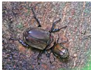
⑦樹液を吸っていたカブトムシとカナブン