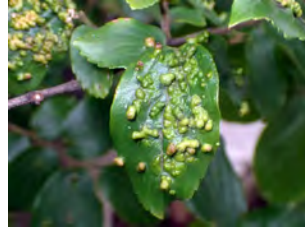
②フシダニによってできた虫こぶのエノキハイボフシ