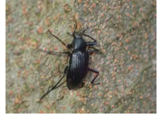
④シラカシの樹幹を歩き回っていたキマワリ