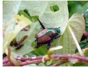
⑨ヤマノイモの葉を穴だらけにして食べていたマメコガネ